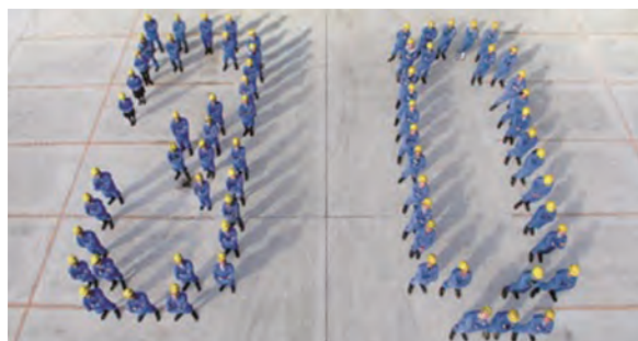
2018年2月、30周年を迎えました