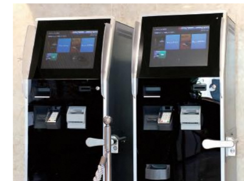
効率化のために導入された自動精算機