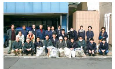
土曜の日「ながさきサンセットロード」一斉清掃に参加