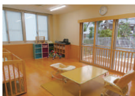
おもやい保育園の様子