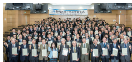
イクボス宣言式 2017年12月28日