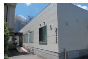
おもやい保育園外観