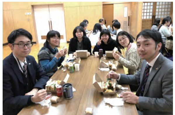
部署を超えたコミュニケーションを図る機会として、社員が集まって食事をする「ランチ会」を定期的を実施。