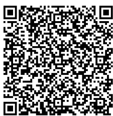
長崎県 電子申請システム

https://apply.e-tumo.jp/pref-nagasaki-u/offer/offerList_detail?tempSeq=6414